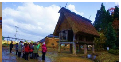
▲桜町 JOMON パーク見学