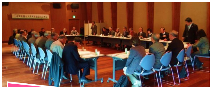
地区社協連絡会入善町社協視察

11月14日、地区社協連絡会議では、入善町社協を訪問し地区社協でのケアネット活動の状況について意見を交わし交流を深めました。ケアネット活動では、迷惑をかけたくない人、遠慮する人々に対しても根気よく対応していくなど、孤立、孤独死をなくすため取り組みについて熱心に話し合い交流を深めました。