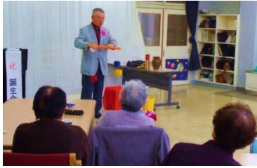
▲お誕生会アトラクショ ン