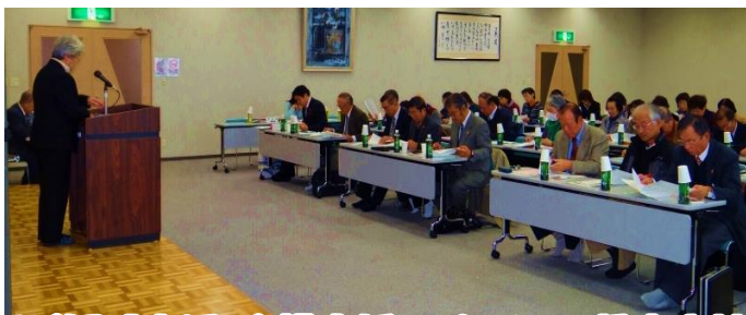
入善町「生活・介護支援サポーター」視察来訪

また、11月19日には、入善町から生活・介護支援サポーター養成研修の一環として41名の受講生や地区社協役員の皆さんが来訪され、「地区社協の活動状況」や白萩南部地区の「移動注文販売」、「おたっしゃ家」を視察され朝から夕方まで1日上市町で過ごされました。