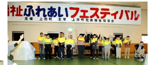
▲四ツ葉園 『ペープサート』