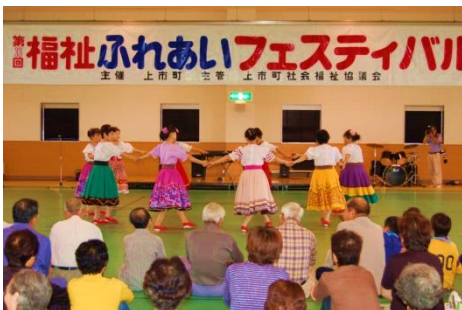
▲スイートピー 『フォークダンス』