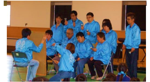
▲むつみの里 『ハンドベル演奏』