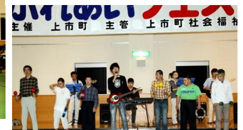
▲上市オールスターズ 『バンド演奏』

10月12日(土)福祉ふれあいフェスティバルが町保健福祉総合センターで開催され、障がい者、高齢者や福祉関係者、ボランティア、町民ら約400名が交流しました。