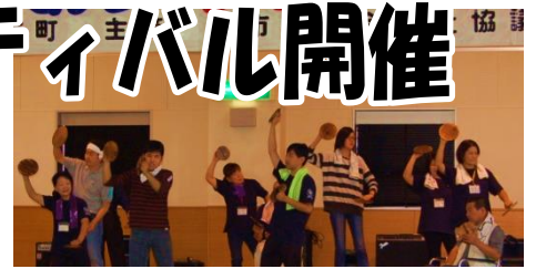
▲ワークハウス 剣 『しげさ節』