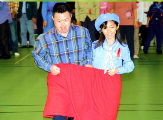
▲ふれあいゲーム『でかパンレース』