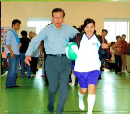
▲ふれあいゲーム『ボール運びレース』