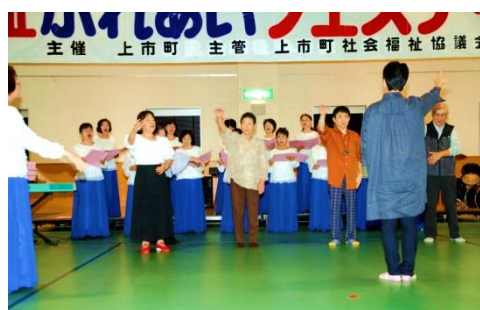
▲手話サークルつるぎの会 上市女声合唱団 『手話コーラス』