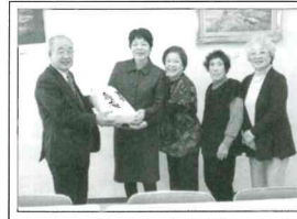
JAアルプス女性部 上市地区のみなさん

J Aアルプス女性部上市地区よりお米11kgの寄付をいただきました。このお米は、上市町食生活改善推進協議会に贈られ、一人暮らし高齢者等の配食サービスに役立てられます。