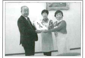
町食生活改善協のみなさん