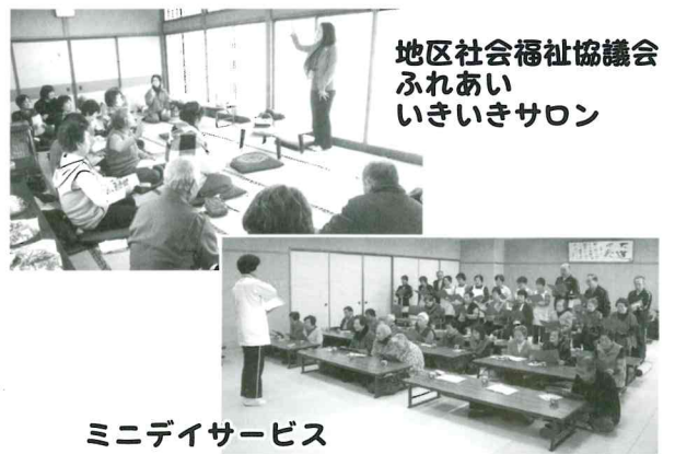
地区社会福祉協議会 ふれあい いきいきサロン