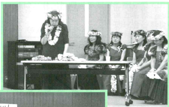
いきいき アロハフラサークルの みなさん