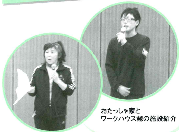
おたっしや家と ワークハウス劔の施設紹介