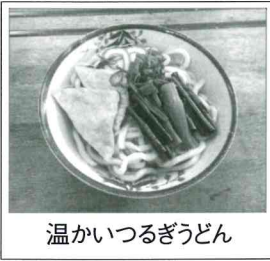
温かいつるぎうどん

1月25日(日)白萩南部公民館では、「種地区・ふれあい冬の集い」が開催され、町内外区出身の皆さん