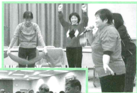
ハッピー ムーブメントの みなさん