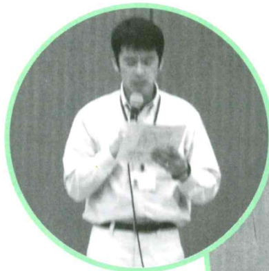
四ツ葉園と むつみの里の 施設紹介