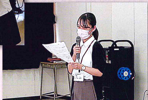
▲実習生からの体験談