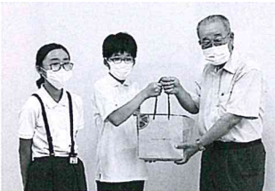
▲義援金を受け取りました。

上市中央小学校つるぎ児童会のみなさんより豪雨災害の義援金を受け取りました。児童会が中心となり、被災地の状況を調べて校内放送で伝えるなどし、募金を集められました。