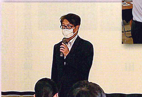
▲清水校長先生から激励のお言葉