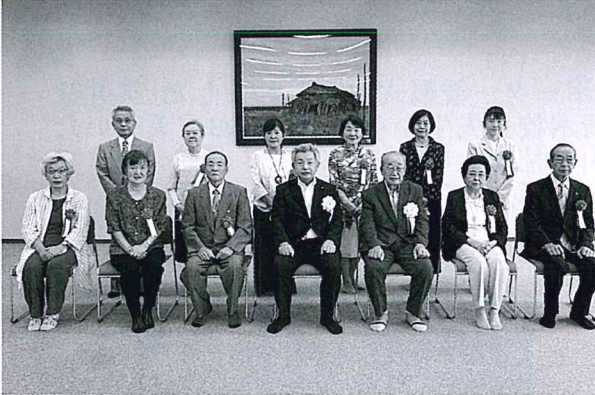
▲受賞者のみなさんで記念写真