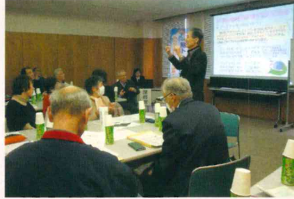
▲富山いきいき脳トレクラブさん