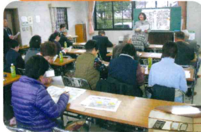
◀問題を出す タイミングも調整