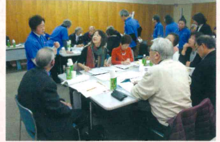
▲実習問題の構成を考えよう