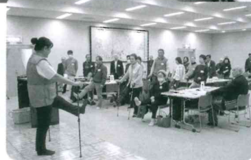
◀ノルディックエクササイズ体験