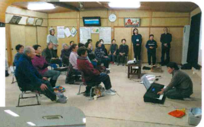
▶脳トレの合間に 歌を入れました