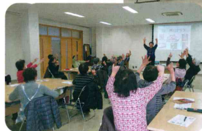
◀手遊びも 大事な脳トレ